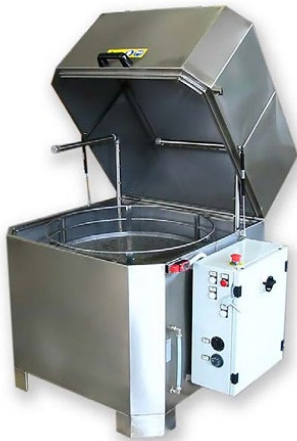
Roterende of translerende mand