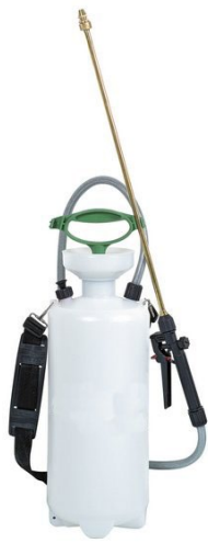
Lagedrukspuiten met waterspoeling