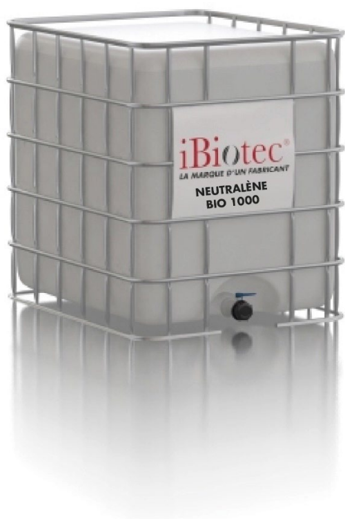
GRV-container 1000 L