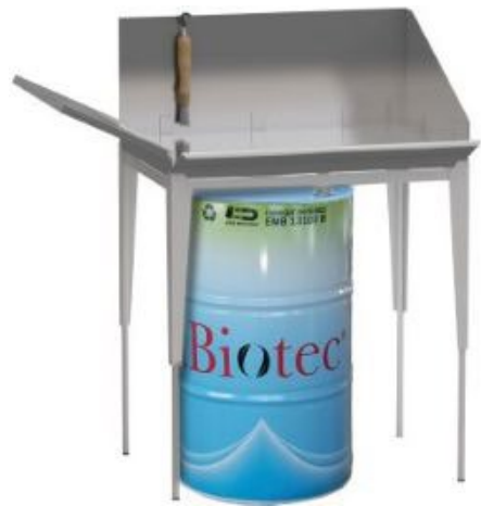
Fonteinen met reinigingsmiddel