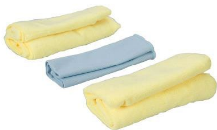
Ontvetting met doek