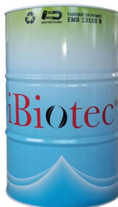
Vat 200 L