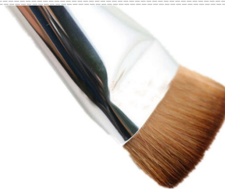
Ontvetting met borstel