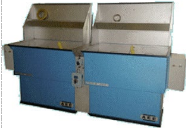
Warme of koude dompeltanks